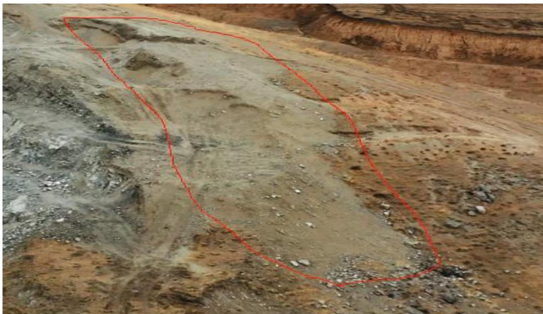
照片 3-3 表土堆 1