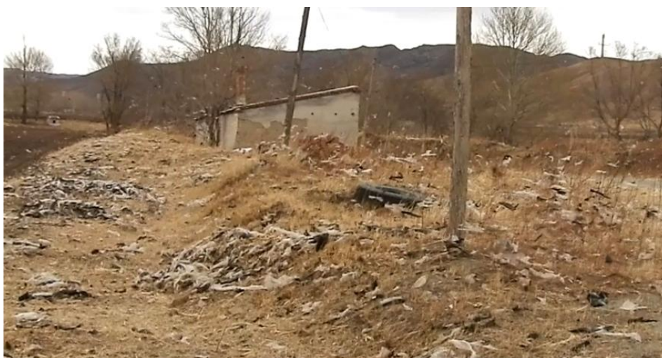
照片 3-7 休息室