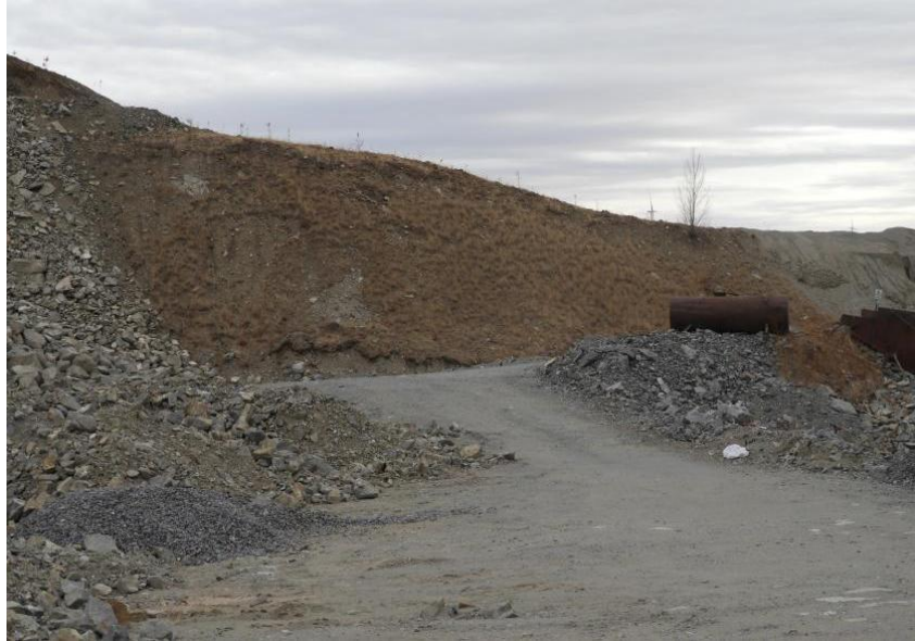
照片 4-4 露天采场超采区