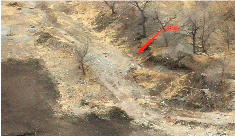
照片 3-9 矿区道路