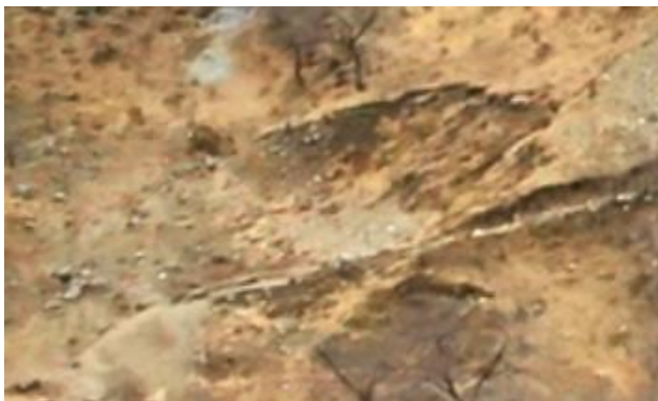
照片 3-5 民采坑