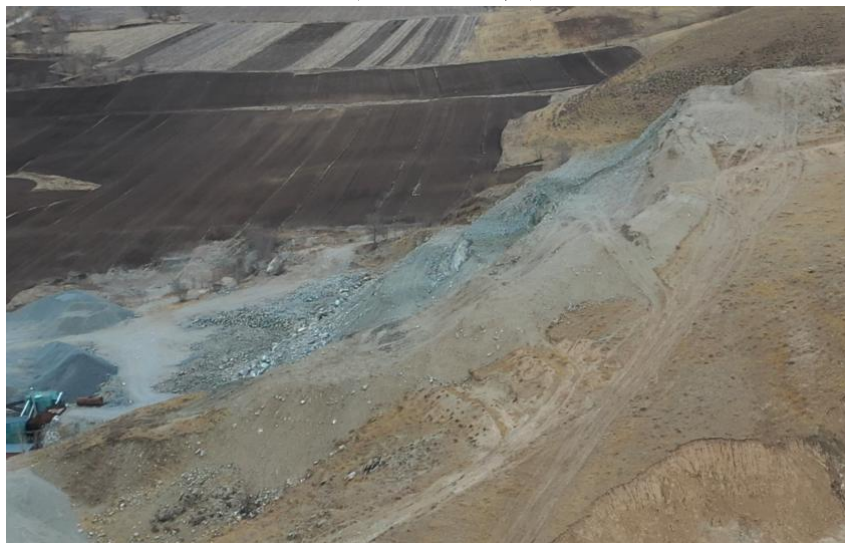
照片 4-6 表土堆