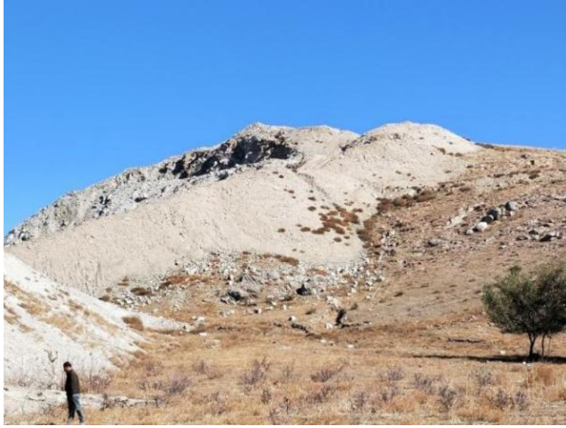
照片 4-2 表土堆放场治理效果