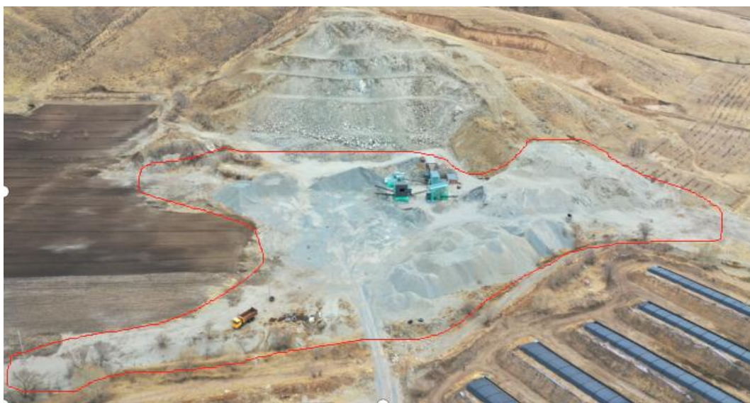
照片 3-2 工业场地