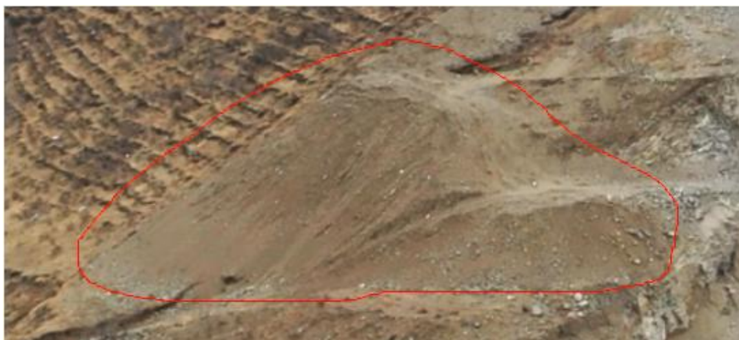
照片 3-4 表土堆 2