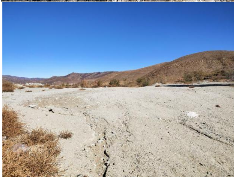
照片 4-3 1#废石粉堆治理效果