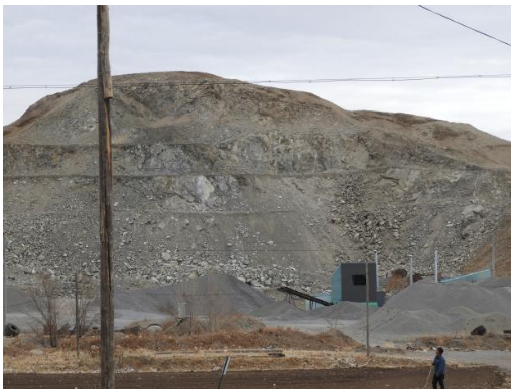
照片 4-1 露天采场高陡边坡现状照片