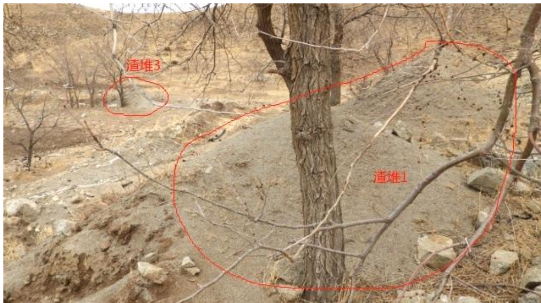
照片 3-6 渣堆（1-3）