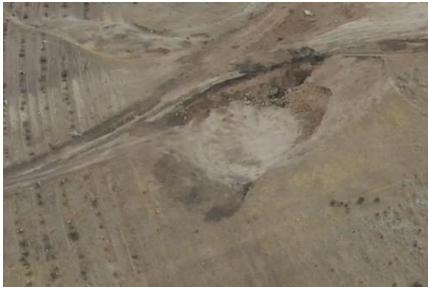
照片 4-5 民采坑