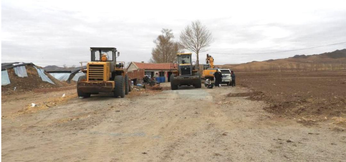
照片 3-8 办公生活区