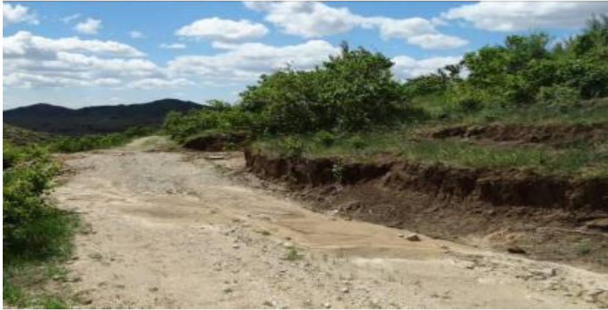
照片 4-5 矿区道路