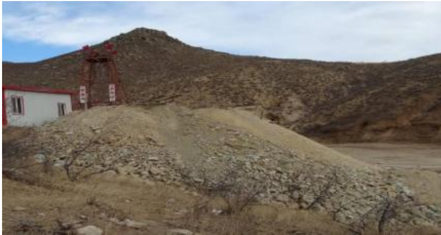
照片 4-3 废石场

为 2136m 3 。现状调查未发生崩塌、滑坡等地质灾害。废石场见照片 4-3。废石量三角网法见图 4-1。