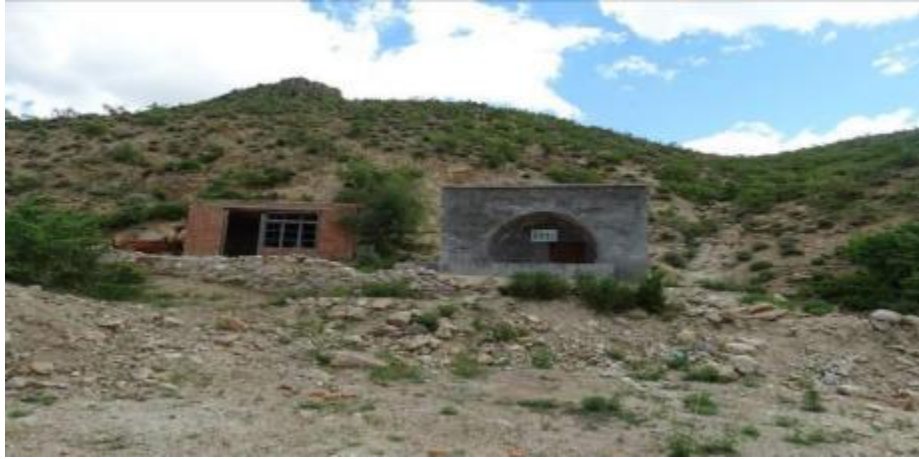
照片 4-2 XJ 工业场地