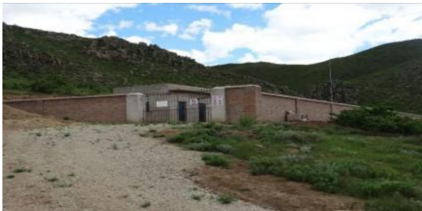
照片 4-6 *****

位于矿区西侧，包括*****、雷管库，占地面积 1235m 2 ，为混凝土建筑物。现状地质灾害不发育。见照片 4-6。