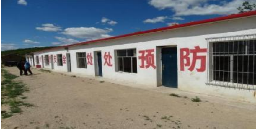
照片 4-4 办公生活区

办公生活区位于矿区南侧缓坡基岩之上，占地面积约为 891m 2 ，地表建筑为彩钢结构平房，现状地质灾害不发育。见照片 4-4。